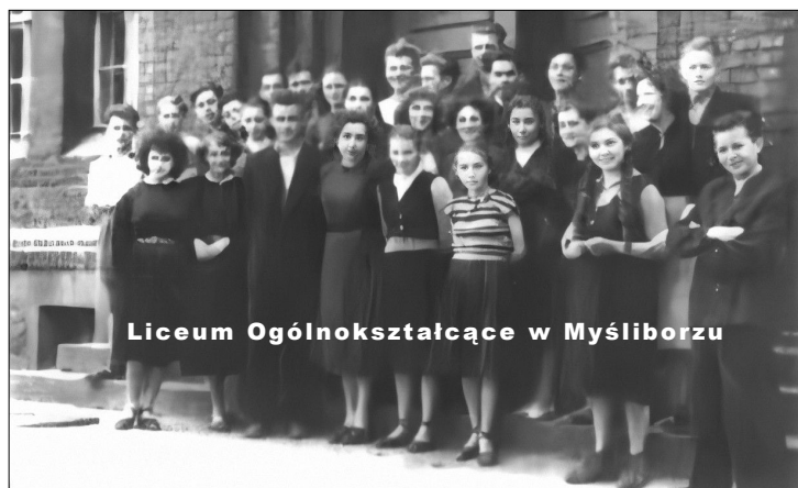
Liceum Ogólnokształcące w Myśliborzu

http://encyklopedia.szczecin.pl/wiki/Plik:Zieliński_Piotr01a.jpg